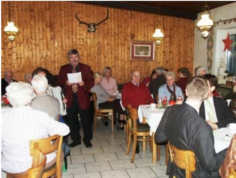
Bei Kerzenschein, Tannenduft und weihnachtlicher Musik kam man ins Gespräch.